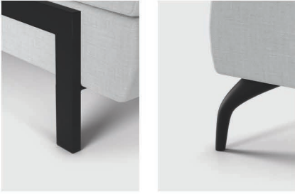
č.1 designová noha č.2 komax noha